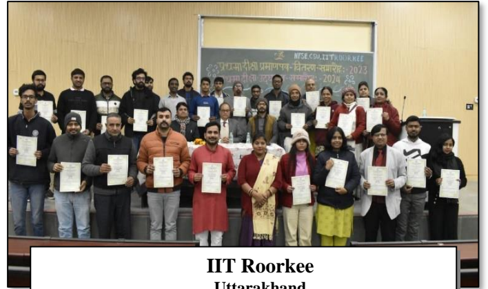
IIT Roorkee Uttarakhand