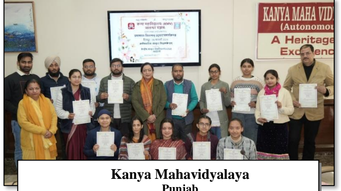
Kanya Mahavidyalaya Punjab