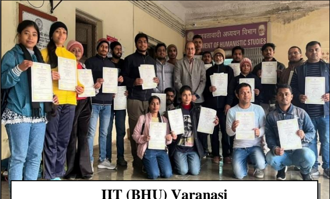
IIT (BHU) Varanasi Uttar Pradesh