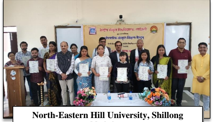
North-Eastern Hill University, Shillong Meghalaya