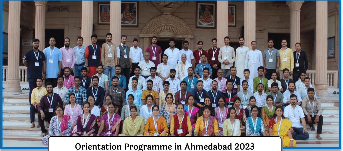
Orientation Programme in Ahmedabad 2023