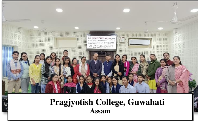
Pragjyotish College, Guwahati Assam