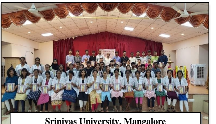
Srinivas University, Mangalore Karnataka