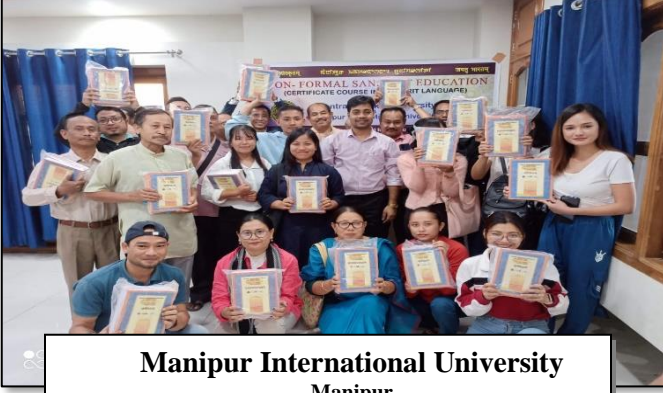
Manipur International University Manipur