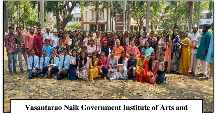
Vasantarao Naik Government Institute of Arts and Social Sciences, Nagpur, Maharashtra