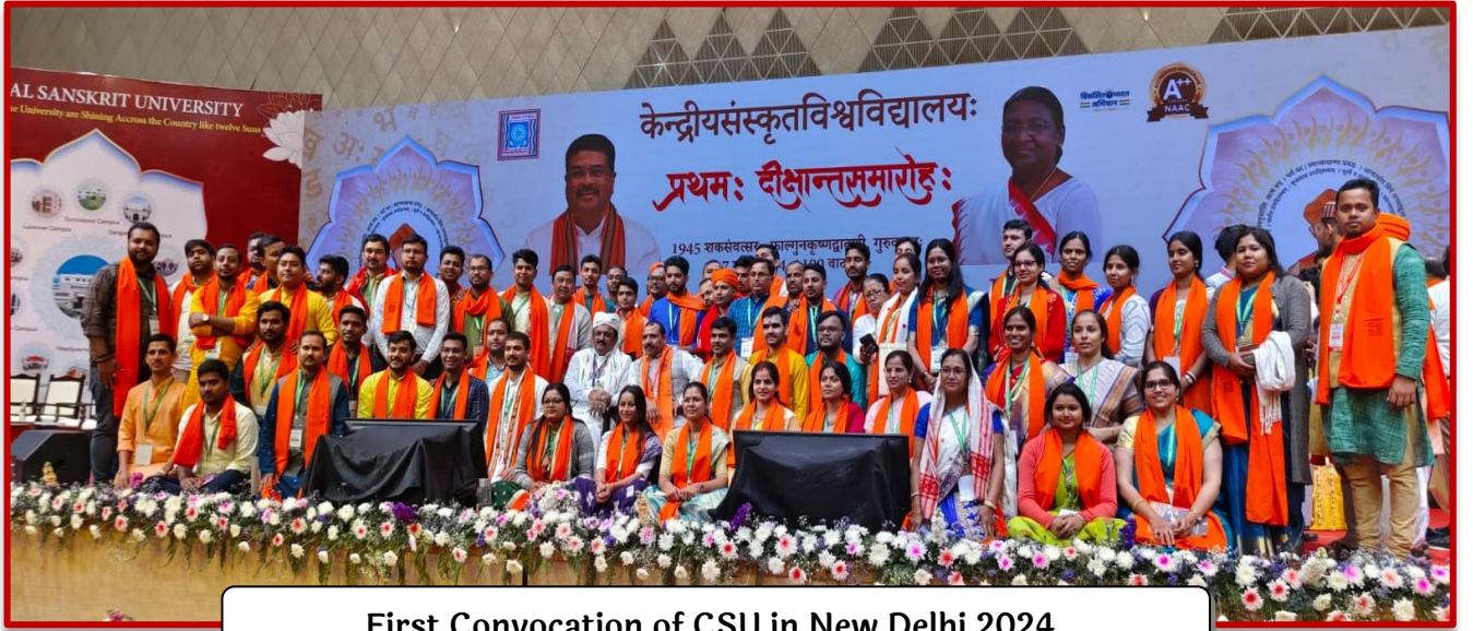
First Convocation of CSU in New Delhi 2024.