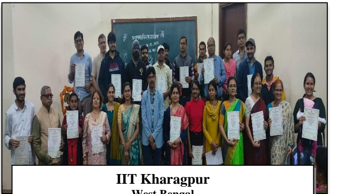
IIT Kharagpur West Bengal