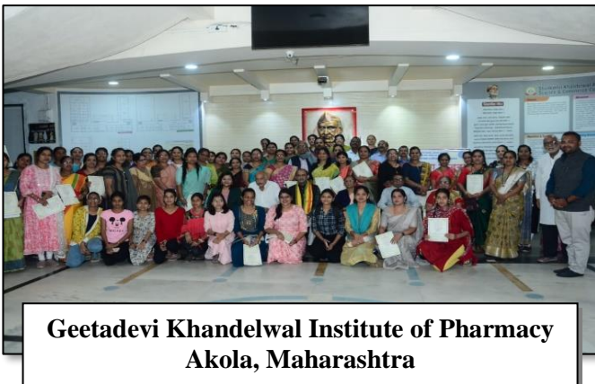
Geetadevi Khandelwal Institute of Pharmacy Akola, Maharashtra