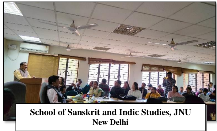
School of Sanskrit and Indic Studies, JNU New Delhi