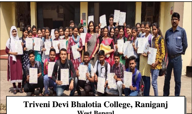
Triveni Devi Bhalotia College, Raniganj West Bengal