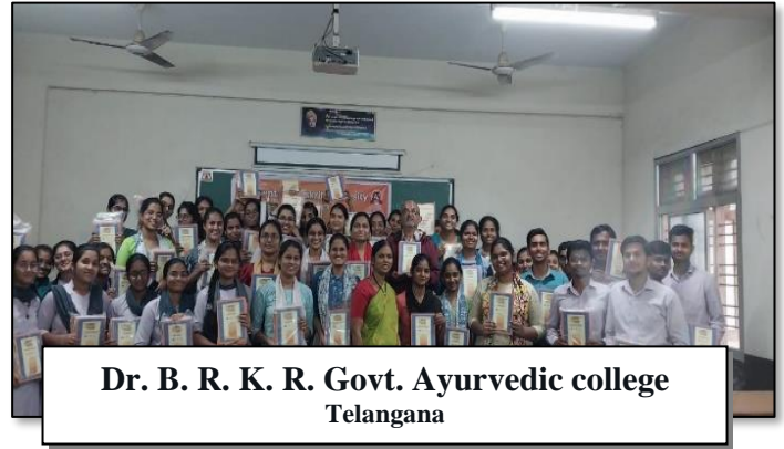
Dr. B. R. K. R. Govt. Ayurvedic college Telangana