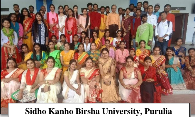
Sidho Kanho Birsha University, Purulia West Bengal